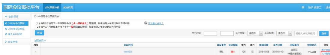
图 2.2.1 国际会议预报列表-文件管理页面

国际会议预报申请提交后，点击预报列表操作栏的文件管理，如图 2.2.1，进入 文件列表 页面如图 2.2.2，点击“ 下载 ”按钮下载国际会议预报申请表（部分内容和格式根据实际需要修改）， 打印签字盖学院公章扫描后待用 。