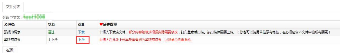
图 2.2.3 文件列表学院预报表上传页面

国际会议预报表 下载、打印签字盖学院公章扫描后 ，需要将扫描件上传，点击“ 上传 ”按钮 上传学院预报表 （国际会议预报申请表签字盖章的扫描件），如图 2.2.3。 注：在单位初审审核之前可以修改上传的扫描件。