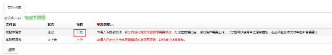
图 2.2.2 文件列表预报申请表下载页面

国际会议预报表 下载、打印签字盖学院公章扫描后 ，需要将扫描件上传，点击“ 上传 ”按钮 上传学院预报表 （国际会议预报申请表签字盖章的扫描件），如图 2.2.3。 注：在单位初审审核之前可以修改上传的扫描件。